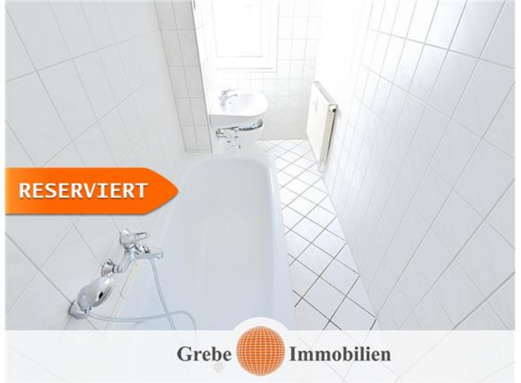
Whg Bsp. Bad