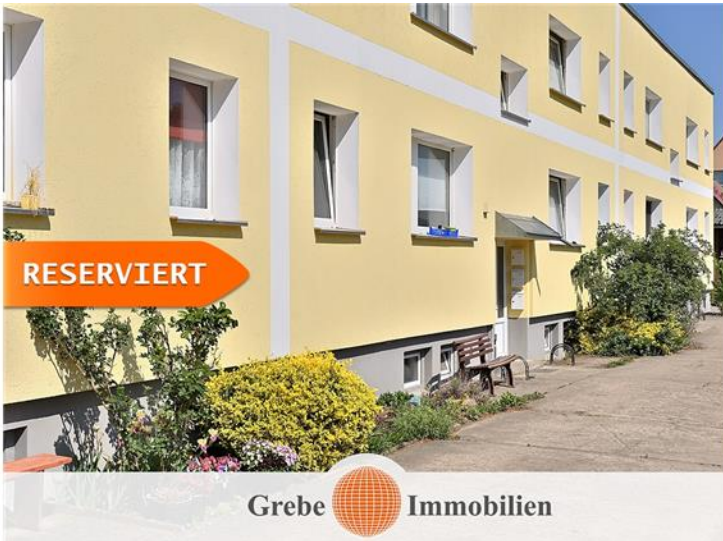
12 Whg a 58 qm