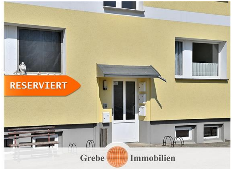
2 Etagen + Vollkeller