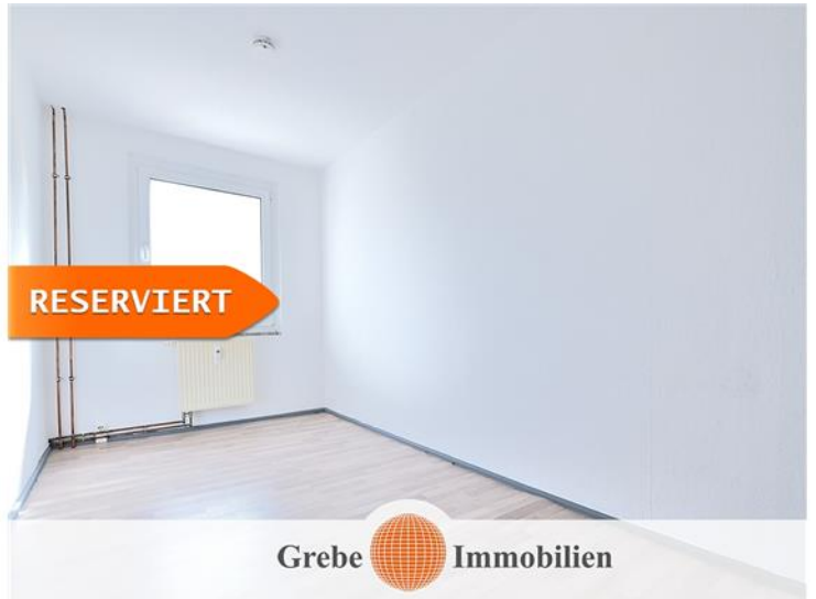
Whg Bsp. Schlafzimmer