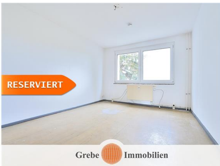
Whg Bsp. Wohnzimmer