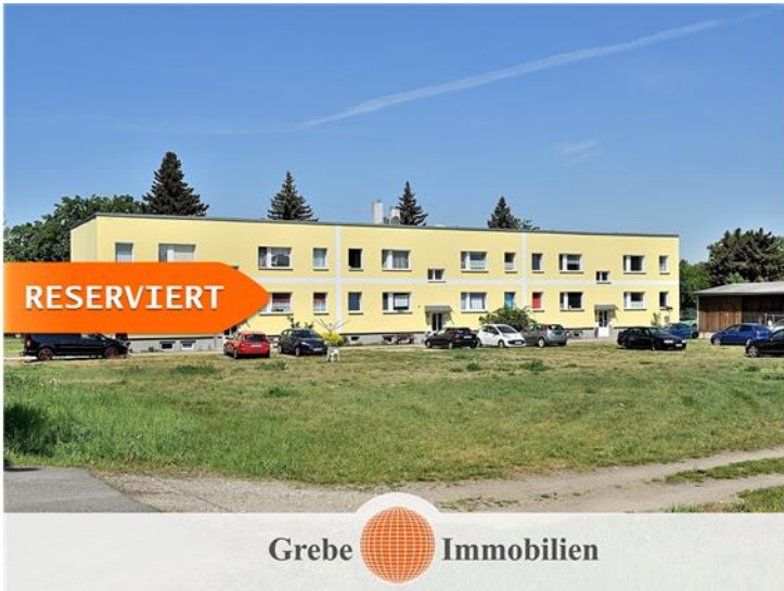
Jüterbog / Kloster Zinna