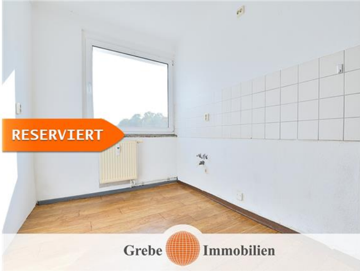
Whg Bsp. Küche