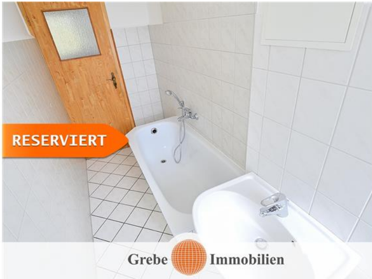
Whg Bsp. Bad 2